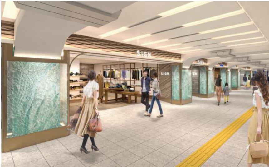
(阪神神戸三宮駅西口から新2番街方面)