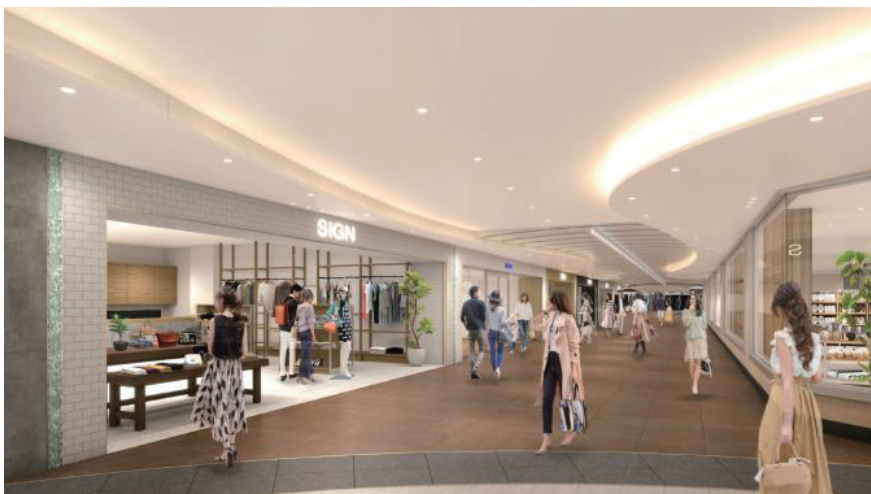
(夢広場から南側方面)