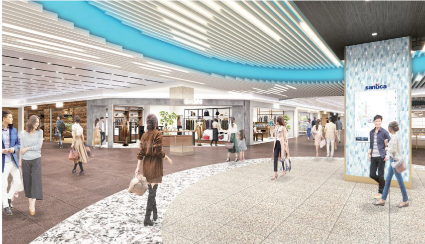
(夢広場から南側方面)