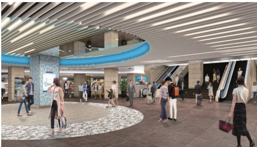
(夢広場から西側方面)