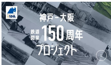
HP トップ画面（イメージ）