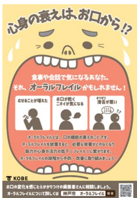
令和 4 年度市政広報ポスター

65 歳を超えている方については、自分事としてオーラルフレイルに関心をもってもらえるよう、今年度は「心身の衰えはお口から」と題して、「むせる、口が乾く、滑舌が悪いなどの症状があればオーラルフレイルかもしれない」という内容の市政ポスターを作成し、地域の自治会、婦人会等約 1,800 団体において、7 月～8 月の 2 か月間掲示した。加えて、「KOBE グー」9 月号で同様の内容を啓発した。