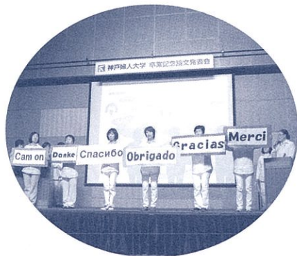
本科3年生発表風景

最後に皆様のご多幸とご健康を心より祈念いたしまして、ご卒業にあたってのお祝いの言葉とさせていただきます。