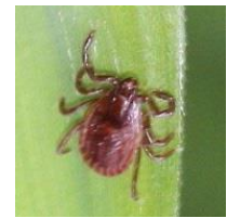
タカサゴキララマダニ