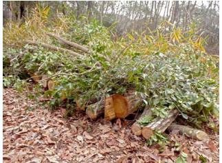
仮伏せ中の原木。運搬は来月。

2月にシイタケ菌を打ち、仮伏せさせていた原木を立てかけるための場所をつくりました。