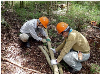
馬(土台)用の木を伐採