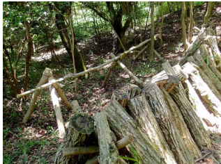
馬が完成 (写真奥側)