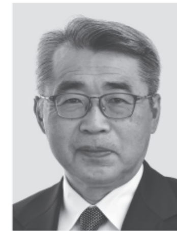
宮崎 まさる 現1 前環境大臣政務官。党環境部会長。埼玉大学工学部卒。64歳。