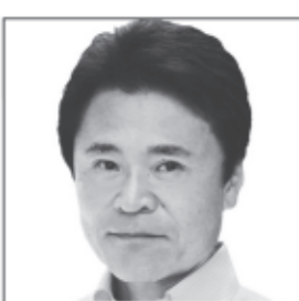
犬猫殺処分ゼロ推進前役員 三ツ星国会議員受賞 前衆議院議員 弁護士 犬猫殺処分ゼロ 保護猫保護犬支援