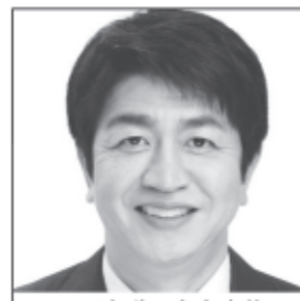
1966年生 慶大卒後、 東京三菱銀行等を経て 衆議院議員2期 減税と規制改革で 日本経済を回せ!