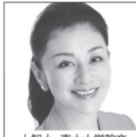
上智大 東大大学院卒 保健学博士 同時通訳 女優 キャスター 100cmの視点を 大切に!