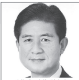
防衛省・自衛隊出身 東日本大震災の担当課長 前衆議院議員 日本を守り抜く! 危機管理のプロ