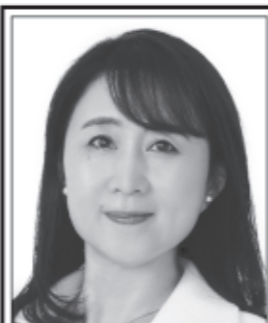
やだ わかこ 国民民主党 副代表 あなたと動けば、 未来は変わる。