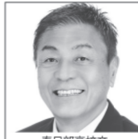
春日部高校卒 慶應義塾大学法学部卒 ヤクルトスワローズ退団 聞き出す 届ける 変えていく