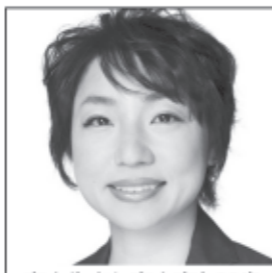
富山生まれ富山育ち38歳 2児の母 市議3期を女性目線で活動 教育と出産無償化で 少子化対策を