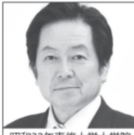
昭和三十二年専修大学大学院 法学研究科出身 茨城維新の会代表 維新の改革を全国へ そして成長へ