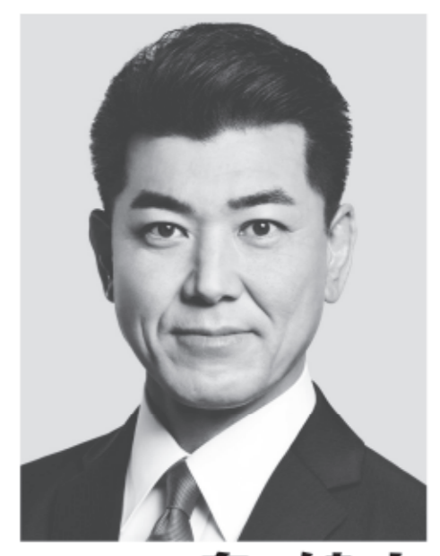
立憲民主党 代表 泉 健太