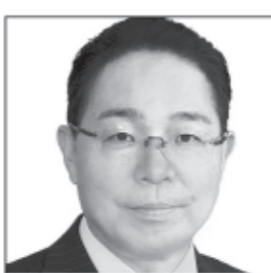
東北大卒 農林水産省 衆議院議員4期 山梨県知事1期 山梨から日本へ、 そして世界へ