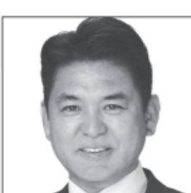
学校法人理事長兼学校長 保護司 元栃木県議 元国会議員秘書 子どもたちの 未来のために