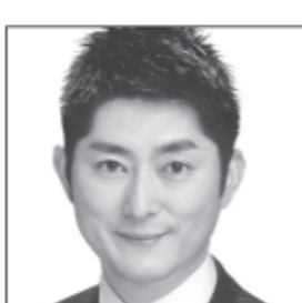
元アナウンサー 元参議院議員 ゲイ当事者として執筆活動 当事者目線の LGBT政策を国会へ