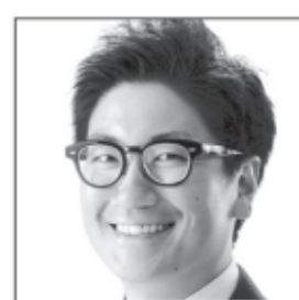
農産法人代表 現33歳 元市議会議員 日本を守るのは俺だ。