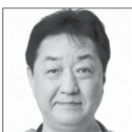
北海道旭川市出身 医師 旭川東高 旭医大卒 傾向クリニック院長 医師の知見をいかした 経済対策!