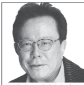
作家・元東京都知事 道路公団民営化委員、 東大客員教授など歴任 日本を動かす、 ビジョンと解決力