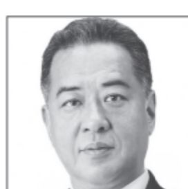
公認会計士 税理士 元堺市議会議員5期 剣道教士七段 誇りある日本を 自分たちで護る