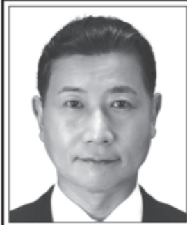
たべい 良和 元衆議院議員 表現の自由を守る・ 日本V字回復やっつる!