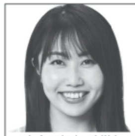
気象予報士 防災士 専門知識を活かして、 日本を防災大国へ! 子育て環境の充実と 災害対策の強化を