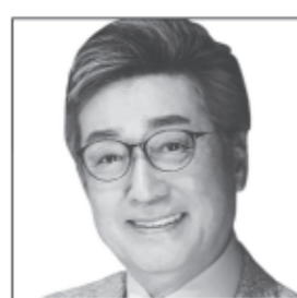
ヒット曲うそ、三味線屋勇次 でお馴染みの歌手俳優、 国政に挑む! うそのない政治で 全世代に活力を!