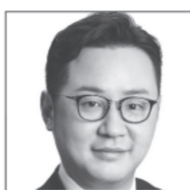
西郷隆盛家直系五代目 東海大卒 IT企業等役員歴任 いまこそ敬愛人、 新しい日本へ。