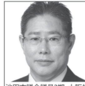
池田市議会議員2期、大阪生 真面高校 関西大学卒業 大阪府大院 京都大院修了 日本大改革! 維新に託す。