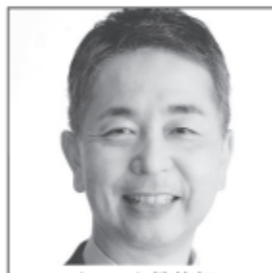
キリスト教教師 東大法学部卒 元外務官僚 社会法人理事長 教師として 神を愛し隣人を愛す