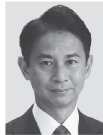
谷あい 正明 現3 元農林水産副大臣、党参議院幹事長。京都大学大学院修士課程修了。49歳。