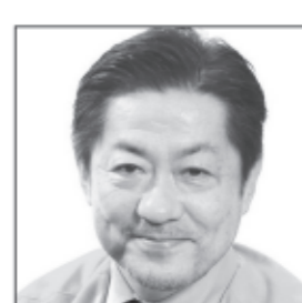
前参議院議員 理学療法士 介護支援専門員 医療創生大客員教授 いのち輝く未来へ 医療介護の大改革