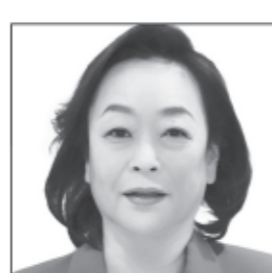
地域活性化プロデューサー 飲食店経営 観光業企画 不屈の伊賀くノ一