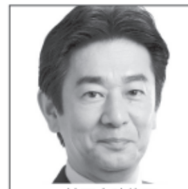
神戸大院修了 兵庫県議4期 社福理事長 戸屋大学客員教授 もっと語ろう、 日本の未来。