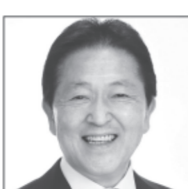
日大農獣医学部卒 特定郵便局長を経て 北海道議会議員を15年務める 新しい北海道を つくります。