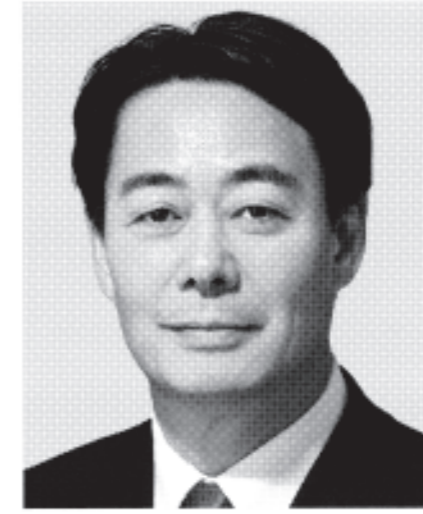
民主党代表 海江田万里