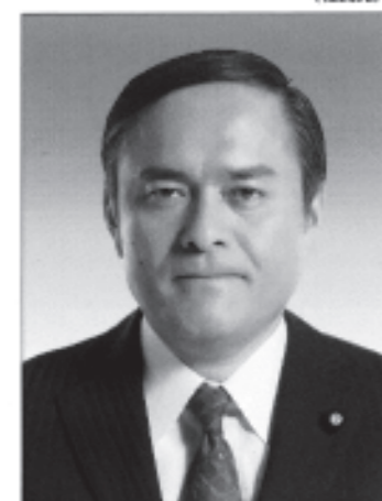
社民党党首 吉田 忠智