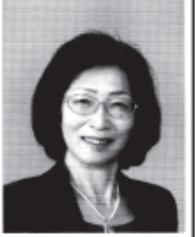
最高裁判所判事 鬼丸かおる 昭和二十四年二月七日生