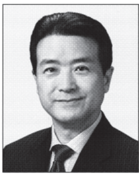
代表 江田 憲司