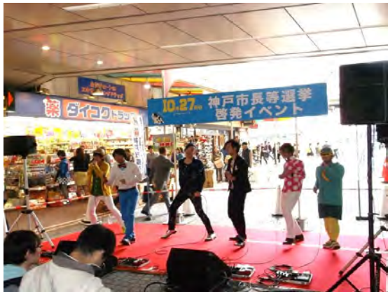
市区合同街頭啓発イベント