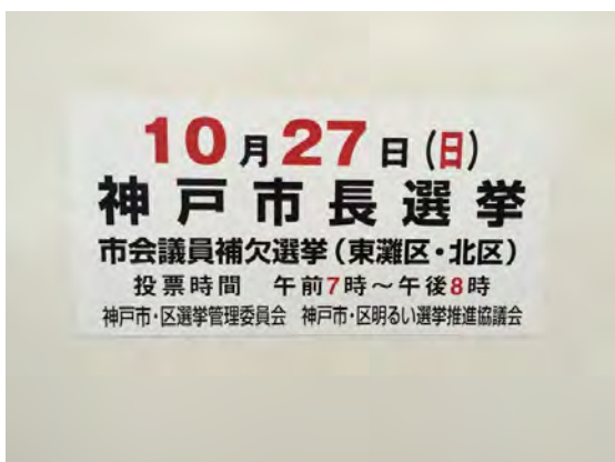
自動車用マグネットシート