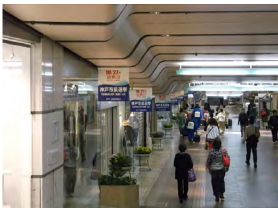
さんちかペナント