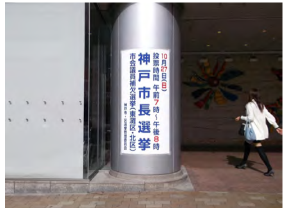
三宮交差点前交通センタービル看板