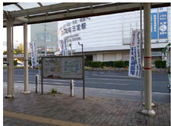
市バス停留所のぼり