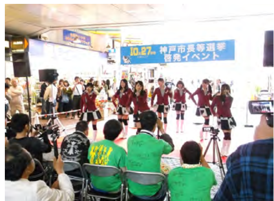
市区合同街頭啓発イベント