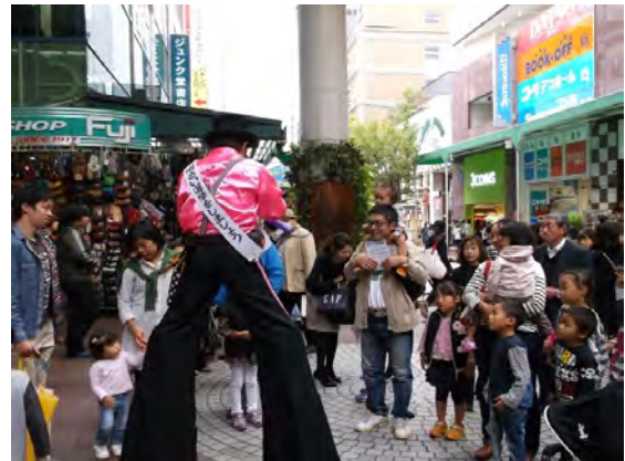
市区合同街頭啓発イベント