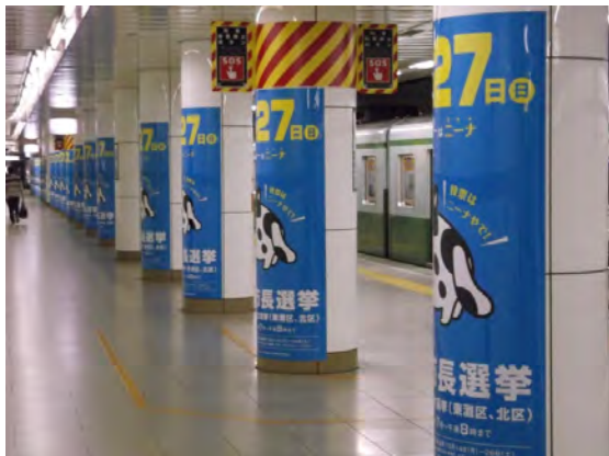
市営地下鉄駅構内広告