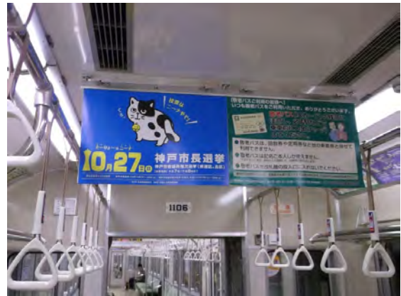
市営地下鉄車内吊広告