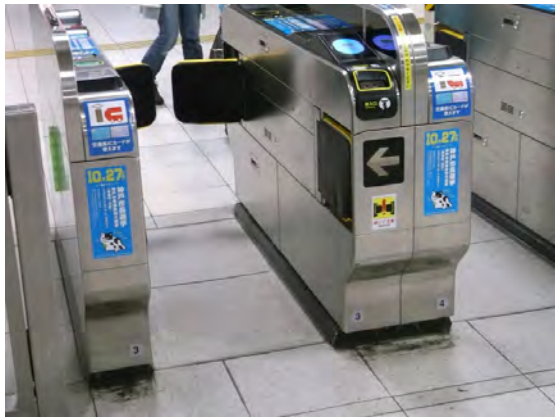
市営地下鉄駅改札ステッカー