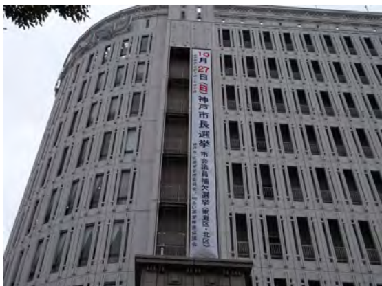
大丸神戸店壁面懸垂幕