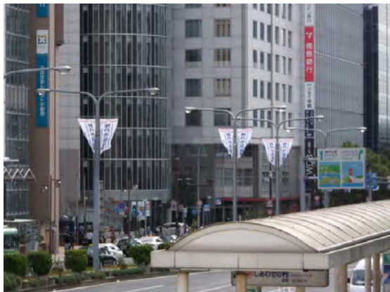
フラワーロードバナー