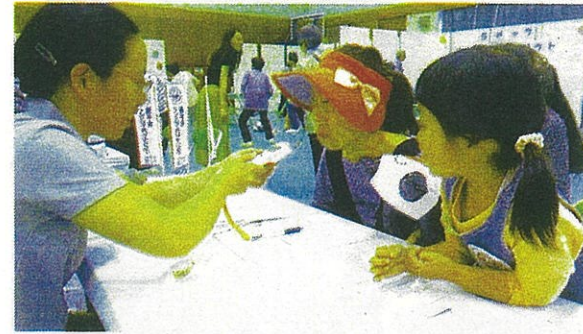
測定ブースの様子