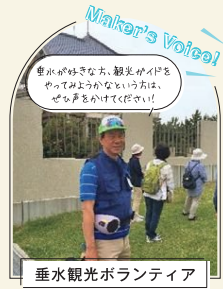
垂水観光ボランティア