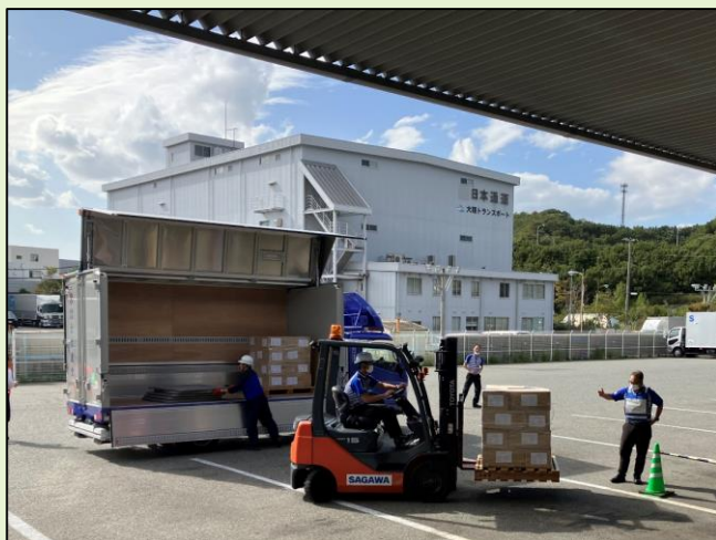
【物資の積み下ろし・検品】