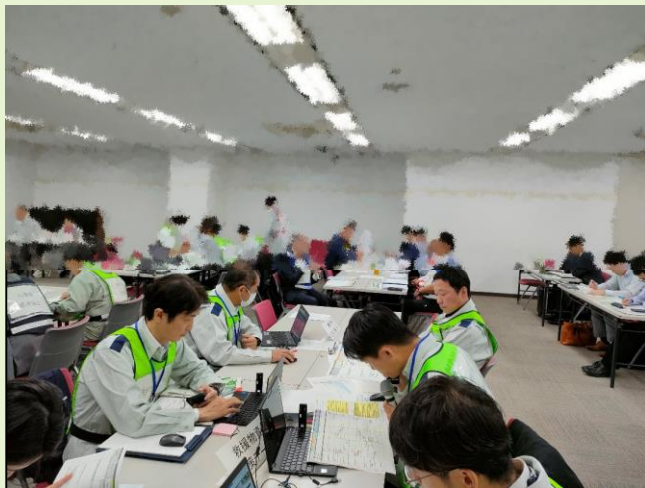
【シナリオに従い手順を確認】