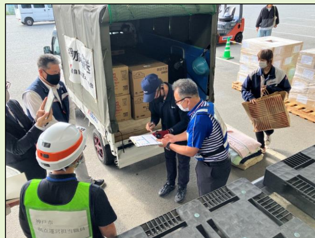
【物資の積み込み・検品】