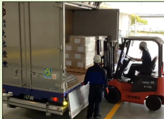
【物資の検品（福祉避難所-サニーライフ白川）】 【物資の積み下ろし（一時保管倉庫-三菱倉庫）】