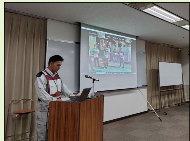
【各拠点の動きをZOOMで共有】