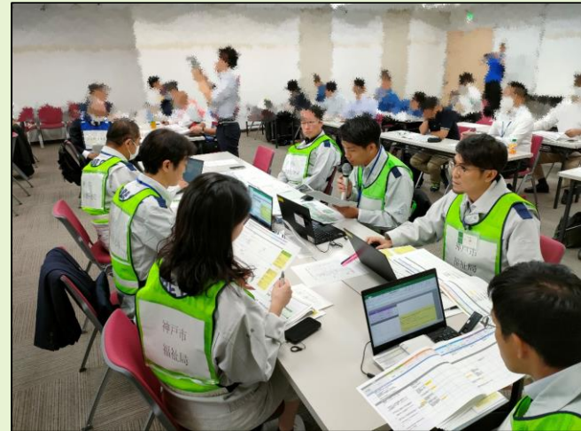
【シナリオに従い手順を確認】