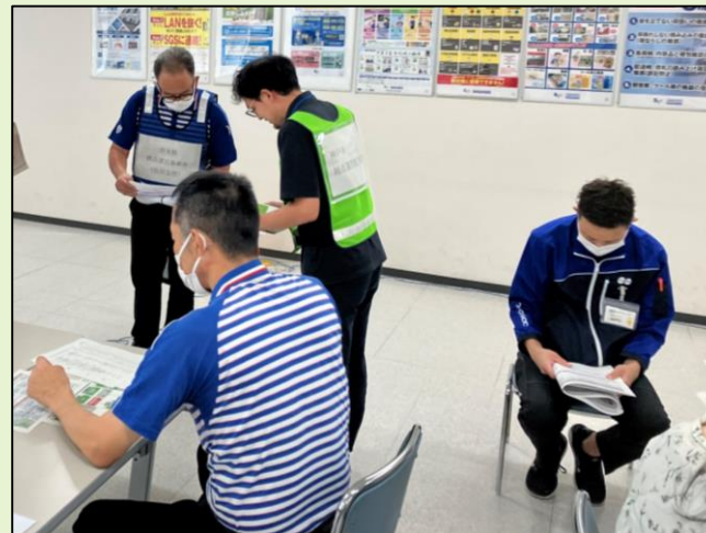
【シナリオに従い手順を確認】