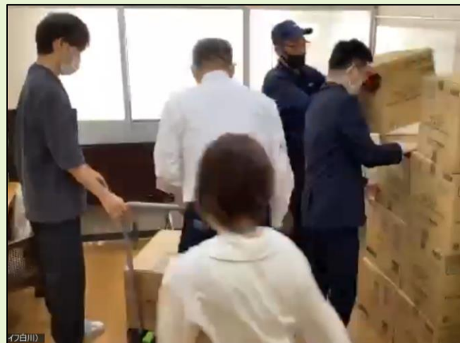
【物資の積み下ろし（避難所-北須磨文化センター）】 【物資の蔵置（福祉避難所-サニーライフ白川）】