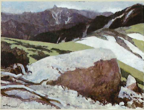
松岡寛一《はるかなる槍ヶ岳》 1979年 油彩・キャンバス 当館蔵

「アカデミー・バー」は、1922年（大正11年）に現在の神戸市灘区・王子動物園付近で開業しました。当時は関西学院前であったため、「アカデミー」という店名がつけられたそうです。関西学院は1929年（昭和4年）に、西宮へ移転しましたが、「アカデミー・バー」は戦前、谷崎潤一郎や佐藤春夫などの文化人が集う、神戸の文化サロンとして有名でした。