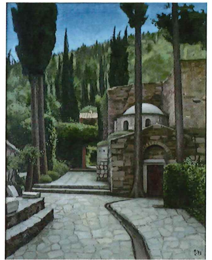
伊藤慶之助《僧院ケサリアニ》 1968年頃 油彩・キャンバス 当館蔵