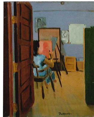
竹中郁《アトリエにて》 1951年 油彩・キャンバス 神戸市立小磯記念美術館蔵