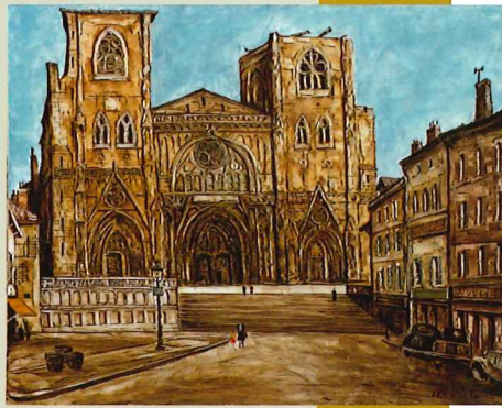
坂本益夫《街角》1961年頃 油彩・キャンバス 当館蔵