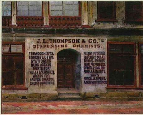
小松益喜《英三番館（第9作）》1940年頃 油彩・キャンバス 北野White House蔵