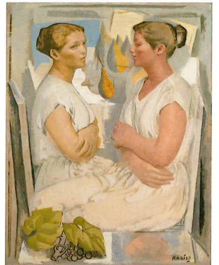
小磯良平《二人の女》 1955年 油彩・キャンバス 神戸市立小磯記念美術館蔵