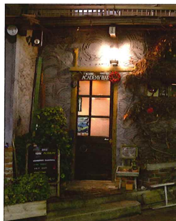
在りし日のアカデミー・バー外観 (2015年撮影)

※神戸ファッション美術館、小磯記念美術館、神戸市立博物館の 当日入館券(半券)をお持ちの方、割引