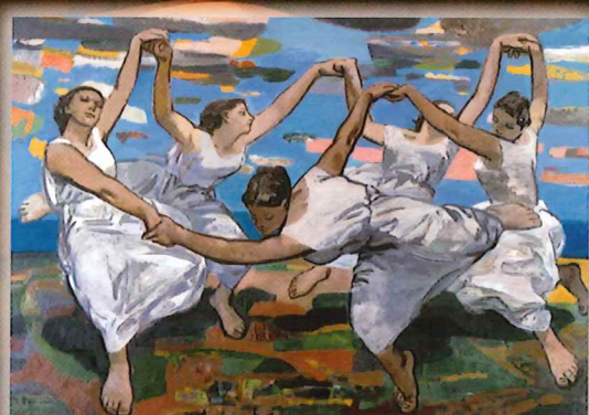
田村孝之介《海をたたえる》 1959年 油彩・キャンバス 当館蔵