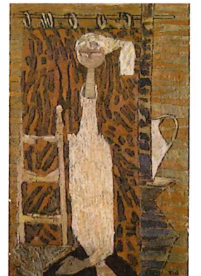
伊藤雄郎《アトリエの女》 制作年不詳 油彩・キャンバス 神戸市立小磯記念美術館蔵