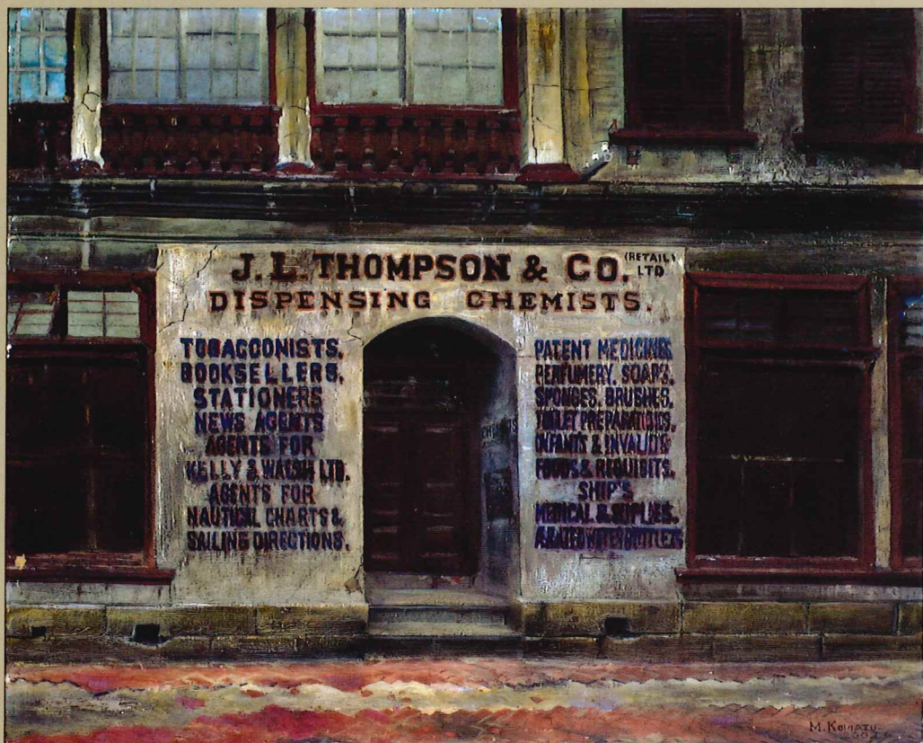
小松益喜《英三番館》1940~42年頃 油彩・キャンバス 神戸・北野White Houseコレクション