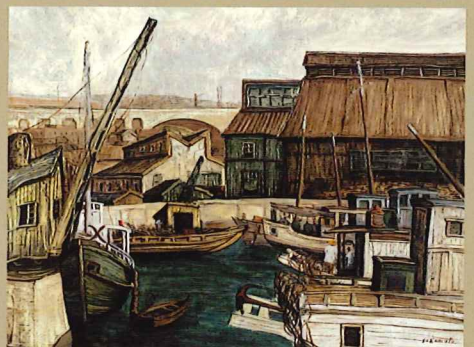
坂本益夫《港》1954年頃 油彩・キャンバス 当館蔵