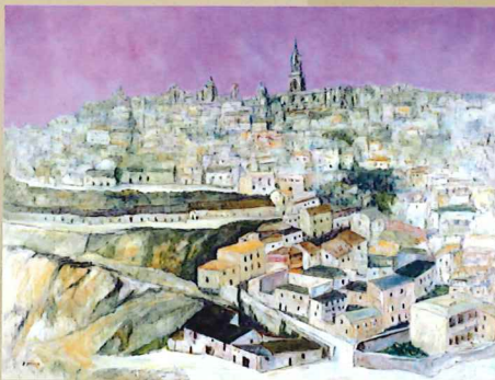
梅宮馨四郎《丘の街》1975年頃 油彩・キャンバス 当館蔵