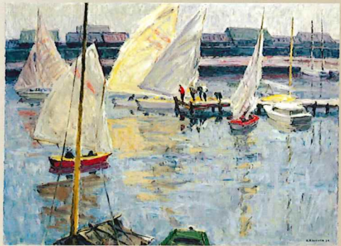
川端謹次《帆風》1964年 油彩・キャンバス 当館蔵