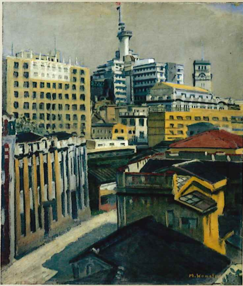
小松益喜《中之島風景》1950年頃 油彩・キャンバス 当館蔵