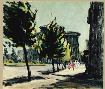
川端謹次《海岸通》1955年頃 油彩・キャンバス 当館蔵