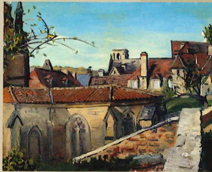
小松益喜《南欧風景》1958～59年頃 油彩・キャンバス 当館蔵